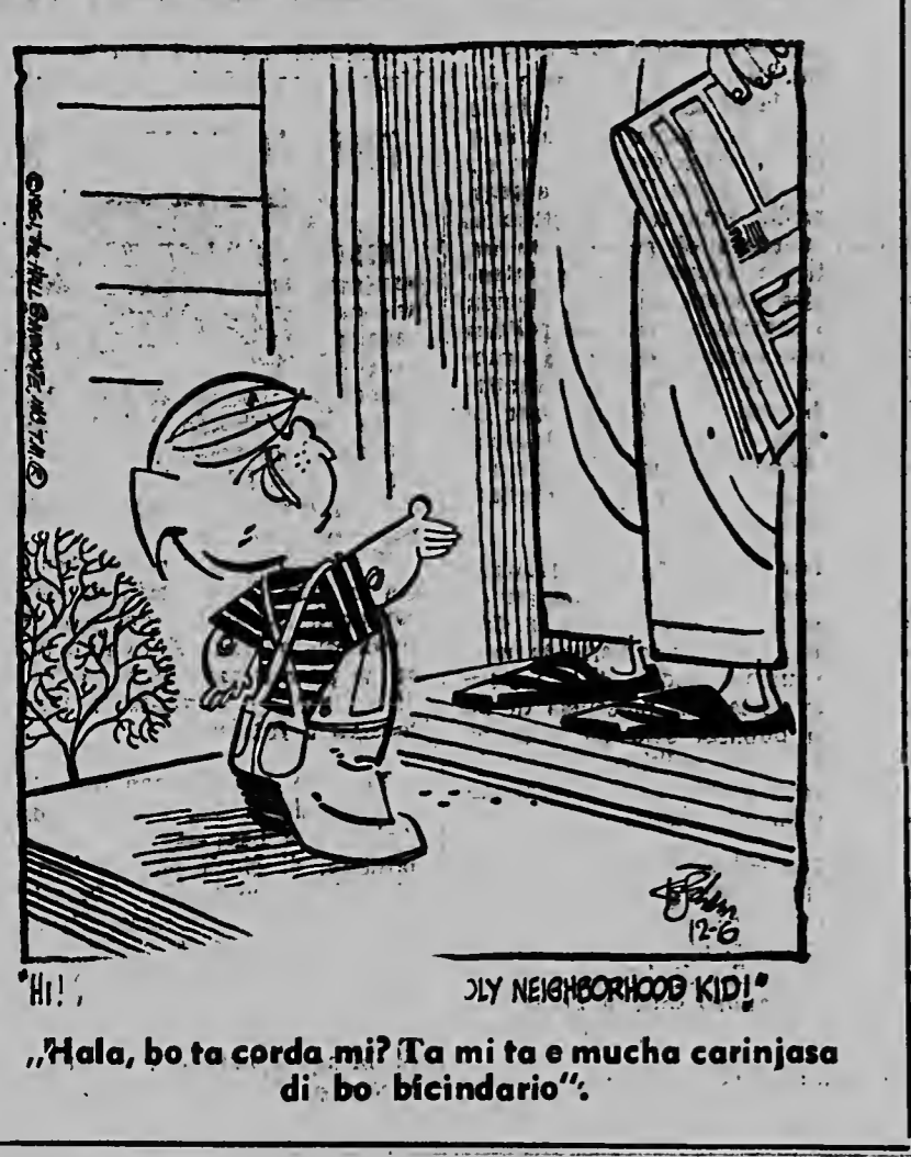
„Hala, bo ta corda mi? Ta mi ta e mucha carinjasa di bo bicindario“